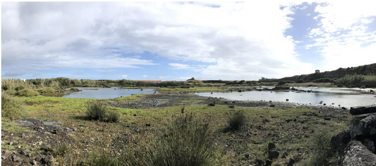
Bild 10 Limikolenrastplatz Cabo da Praia, Terceira (Adrian Jordi)