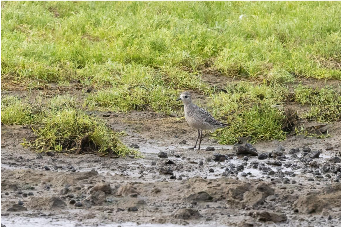
Bild 9 Prärie-Goldregenpfeifer, Cabo de Praia, Terceira (Adrian Jordi)

Nach einem letzten Frühstück in unserem schönen Hotel mit Meerblick reisen wir von Terceira aus via Lissabon zurück in die Schweiz.