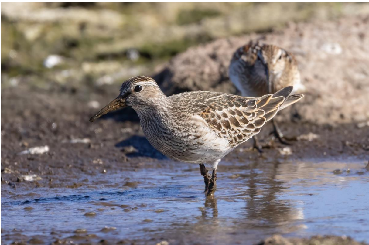
Bild 4 Zwei von sechs Graubruststrandläufern, Achada da Furnas, Sao Miguel

Im Westen der Insel suchen wir nach einem der seltensten Brutvögel der Westpaläarktis, dem endemischen Azorengimpel. Knapp 1000 Vögel leben an den Hängen rund um den Pico de Vara. Nach intensiver Suche gelingt es uns, einen adulten Vogel zu sehen. Dazu hören zwei weitere Individuen. Den Mittag verbringen wir am See bei Furnas. Neben qualmenden Fumarolen und kochenden Schlammlöchern widmen wir uns dem Ufer des Sees. Nach kurzer Zeit entdecken wir mit dem Bindentaucher unsere zweite amerikanische Art. Zwei Seidenreihler sitzen auf einem Floss. Nachmittags suchen wir im Landwirtschaftsgebiet zwischen Furnas und Ponta Delgada nach seltenen Durchzüglern. An einem kleinen im Wiesland versteckten Tümpel sehen wir einen Trupp von sechs (!) Graubruststrandläufern, begleitet von drei Bekassinen. An einem weiteren kleinen See überrascht uns ein Sanderling. 15 Sichler sitzen in den Bäumen und wir stellen fest, dass ein Vogel auf einem Nest sitzt. Der erste Bruthinweis für die Azoren überhaupt!