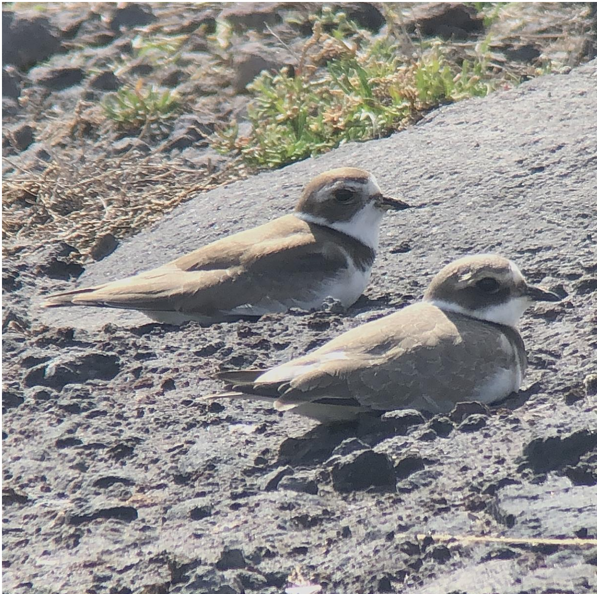
Bild 8 Amerikanischer Sandregenpfeifer (hinten) und Sandregenpfeifer, Cabo de Praia, Terceira (Adrian Jordi)

Besonderes. Im Verlaufe des Tages besuchen wir zwei Mal unseren Lieblingsplatz Cabo da Praia. Alle an den Vortagen gesehene Limikolen versammeln sich bei Flut auf einer Kiesfläche auf engstem Raum. Dabei kommt mit dem Amerikanischen Sandregenpfeifer unsere achte amerikanische Limikolenart dazu. Ein Sichler fliegt vorbei und bringt alle anwesenden Limikolen zum Auffliegen. Bevor wir den Tag in einem Restaurant ausklingen lassen und eine lokale Fischspezialität geniessen, besuchen wir das Städtchen von Praia de Vitoria. Kirchen in blau-weiss und gelb-weiss sind ein schönes Fotomotiv.