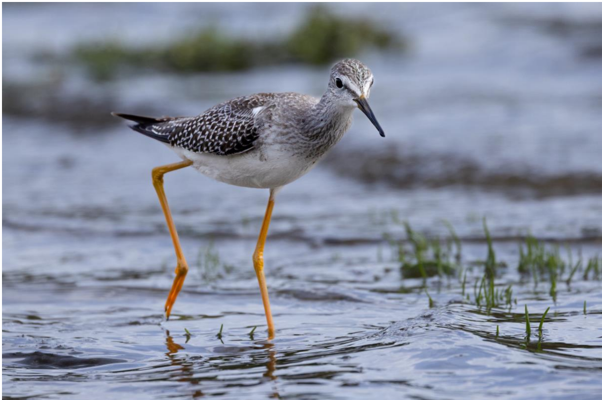
Bild 6 Kleiner Gelbschenkel, Cabo de Praia, Terceira

Am Mittag fliegen wir von Sao Miguel auf Terceira, die Hauptinsel auf der zentralen Inselgruppe der Azoren. Unser Hotel liegt direkt am Meer und ist nur drei Minuten vom besten Gebiet für seltene Limikolen in der Westpaläarktis entfernt: Cabo da Praia. In einem alten Steinbruch gelegen, bietet das kleine Gebiet beste Rastbedingungen für Limikolen. Insgesamt 17 verschiedene Limikolenarten sehen wir hier in kurzer Zeit: Aus Amerika stammen der sehr seltene Kleine Schlammläufer, zwei Kleine Gelbschenkel, drei Sandstrandläufer und zwei Graubruststrandläufer. Weiter dazu kommen Sand- und Seeregenpfeifer, Kiebitzregenpfeifer, Steinwälzer, Knutt, Alpen-, Sichel- und Zwergstrandläufer, Sanderling, Uferschnepfe, Kampfläufer, Regenbrachvogel und Grünschenkel. Alle lassen sich auf kurze Distanz im schönsten Abendlicht beobachten. Abends feiern wir den erfolgreichen Tag in einem lokalen Restaurant in Praia de Vitoria.