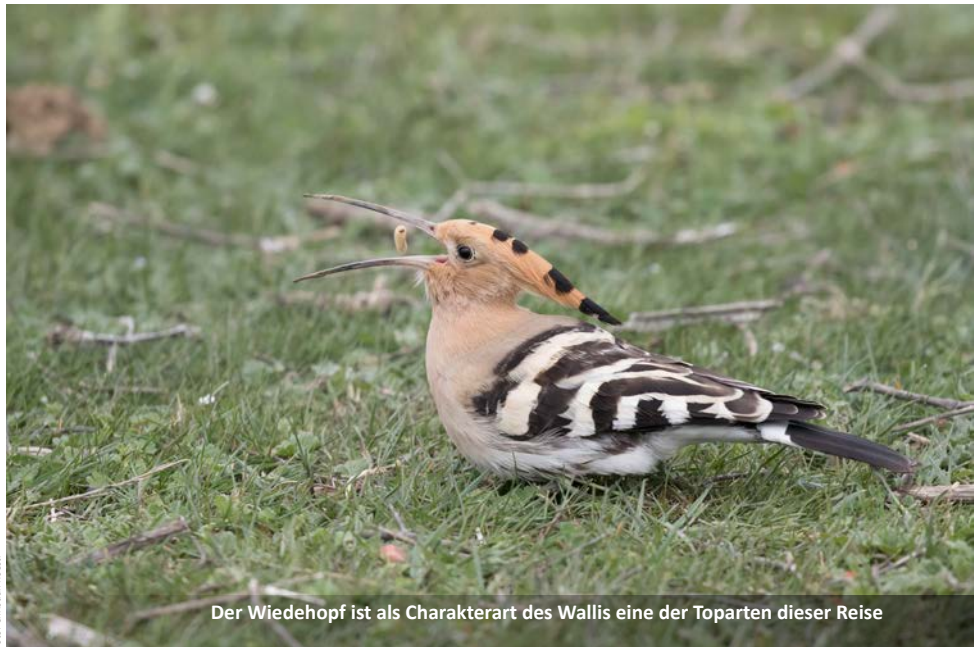
Der Wiedehopf ist als Charakterart des Wallis eine der Toparten dieser Reise

Wir verbringen zwei ganze Tage im Zentralwallis. Dabei besuchen wir die südexponierten Hänge mit Felsensteppe und noch extensiv bewirtschafteten Kulturlflächen. In der Waldbrandfläche oberhalb von Leuk können wir den Gartenrotschwanz beim Singen beobachten. Hier stehen die Chancen gut, ein Steinhuhn zu hören oder sogar zu sehen. Der Steinrötel ist eines der Highlights der Reise. Er brütet in steilen, felsigen Gebieten und kann regelmässig auf abgestorbenen Bäumen beim Singen beobachtet werden. Eine Beobachtung der grossen Greifvögel Stein- und Schlangennadler ist hier gut möglich und vielleicht entdecken wir