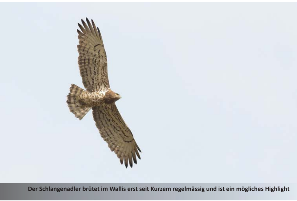
Der Schlangennadler brütet im Wallis erst seit kurzem regelmässig und ist ein mögliches Highlight

In der Talebene besuchen wir verschiedene Feuchtgebiete und das Kulturland. Hier stehen die Chancen gut, einen seltenen Reiher zu entdecken, möglich sind Grau-, Purpur-, Nacht-, Rallen- oder sogar Kuhreiher. In den dichteren Buschgruppen singen die Nachtigall und der Orpheusspötter. In der Nähe des Golfplatzes besuchen wir das Beobachtungshide, wo der Bienenfresser brütet. Hier fühlt man sich fast wie im südlichen Europa. In den sandigen Abbruchkanten brüten mittlerweile