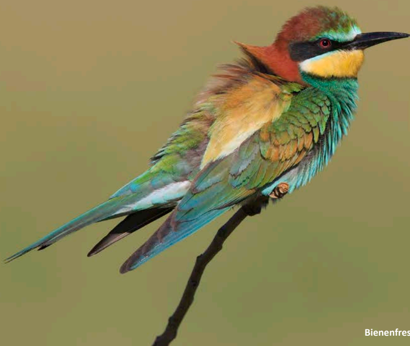
Bienenfresser, farblich ein absolutes Highlight der Reise

Mögliche Highlights der Reise: Schlangenadler, Bienenfresser, Wiedehopf, Neuntöter, Wendehals, Steinrötel, Gartenrotschwanz, Zaun- und Zippammer, Zwergohreule, Tagfalter und schöne Pflanzen, verschiedene Zugvögel, viel Zeit zum Beobachten