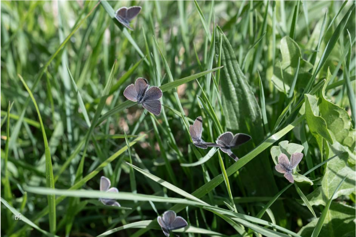
Ansammlung von Zwergbläulingen ( Cupido minimus ) (Thomas Heim)

Danach machen wir uns auf den Weg ins Wallis und machen einen kleinen Stopp in Planey, um ein paar Steinfliegen zu finden. Danach sieht Thomas seinen Lieblingsfalter aus dem Auto heraus, den Trauermantel ( Nymphalis antiopa ). Wir müssen nochmals stoppen, das ist ein echtes Highlight.