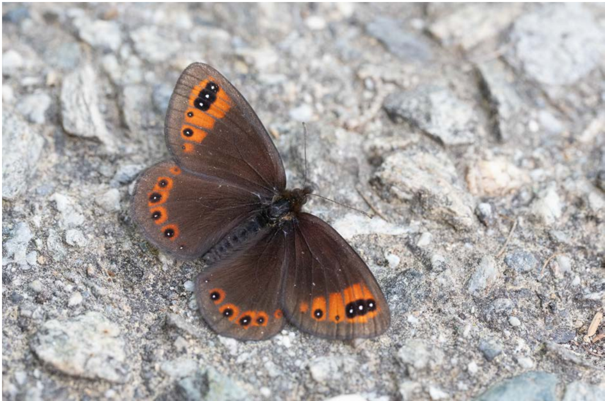
Männchen der Alpen-Erebie ( Erebia triarius ) (Christian Roesti)