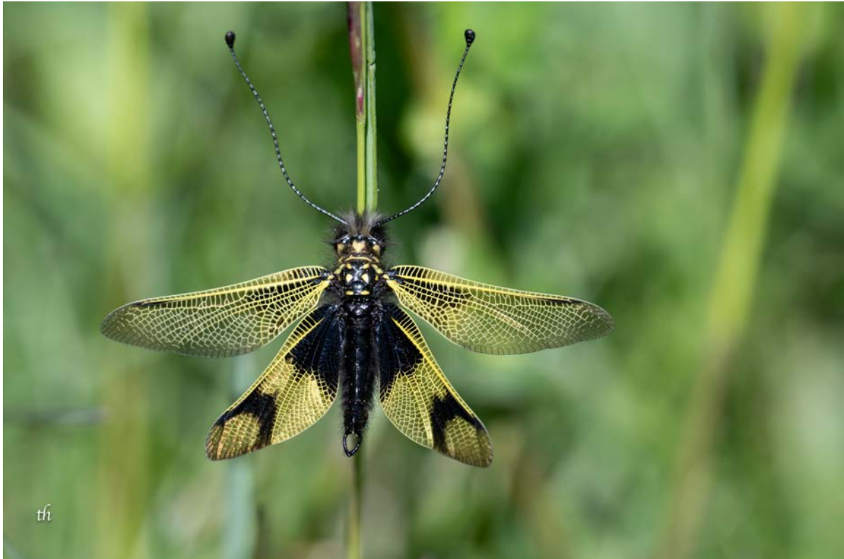
Männchen des Langfühlerigen Schmetterlingshafts ( Libelloides longicornis ) (Thomas Heim)