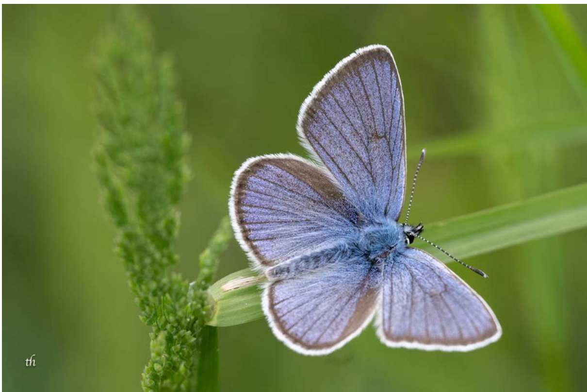
Männchen vom Rotklee-Bläuling ( Cyaniris semiargus ) (Thomas Heim)