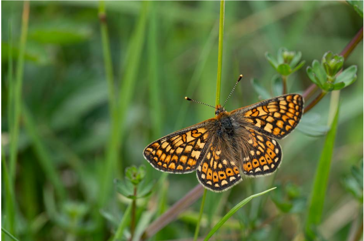
Skabiosen-Scheckenfalter ( Euphydryas aurinia ) (Christian Roesti)