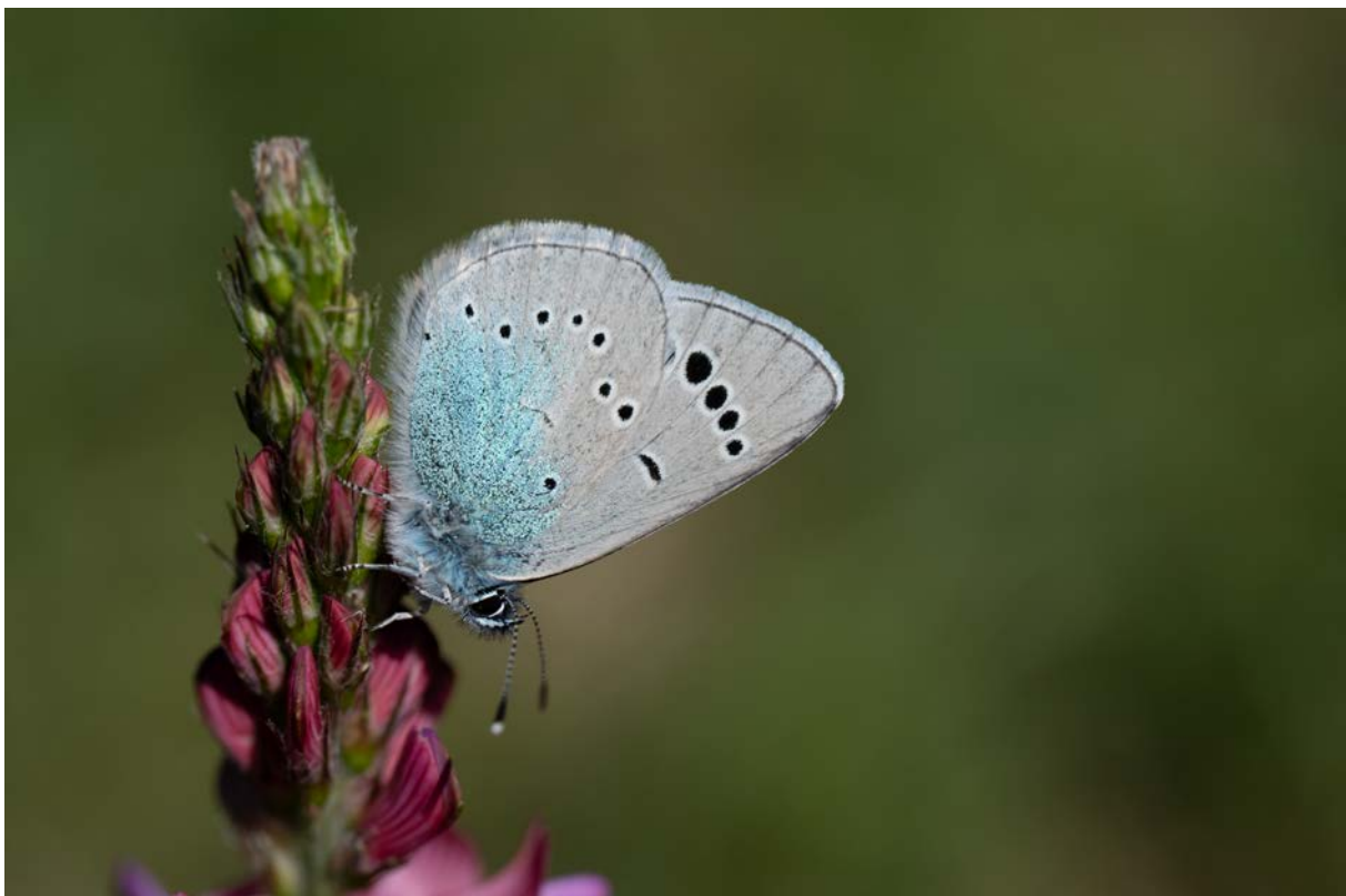
Alexisbläuling ( Glaucopsyche alexis ) (Christian Roesti)