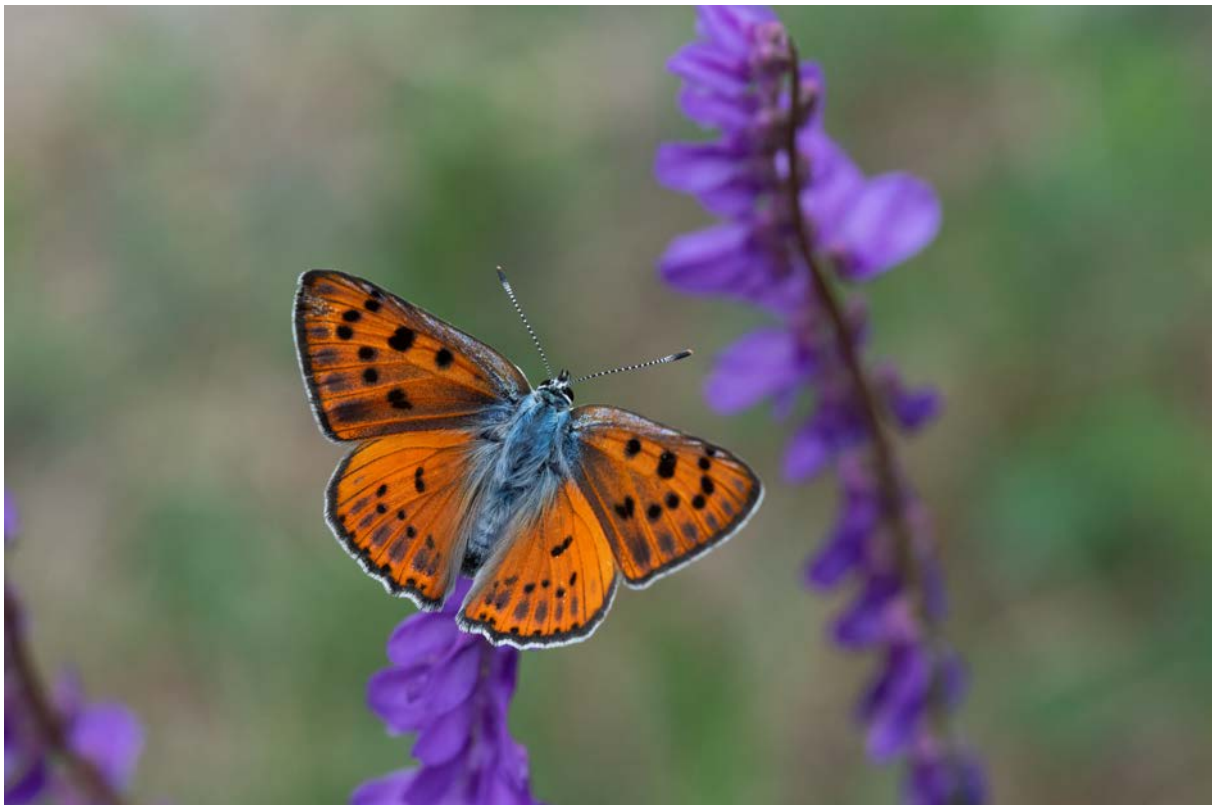
Violetter Feuerfalter ( Lycaena alciphron ) (Christian Roesti)

Der Violette Feuerfalter ( Lycaena alciphron ) ist sicherlich ein riesiges Highlight, mit dem wir nicht gerechnet hätten. Aber auch der Wundklee-Bläuling ( Polyommatus dorylas ) oder der Kardinal ( Argynnis pandora ) sind schön. Wir fotografieren noch ein Weibchen der Smaragdeidechse bevor wir