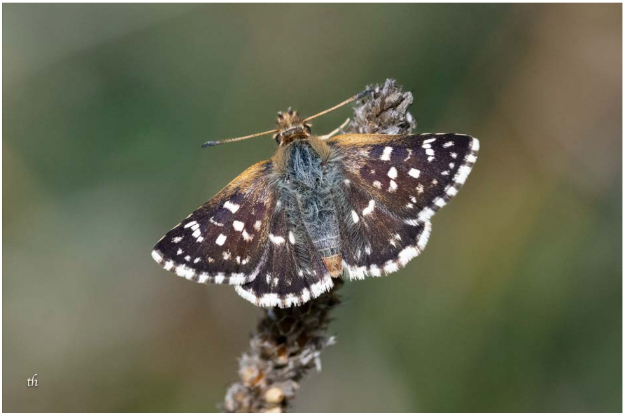
Weibchen des Roten Würfel-Dickkopffalters ( Spialia sertorius ) (Thomas Heim)