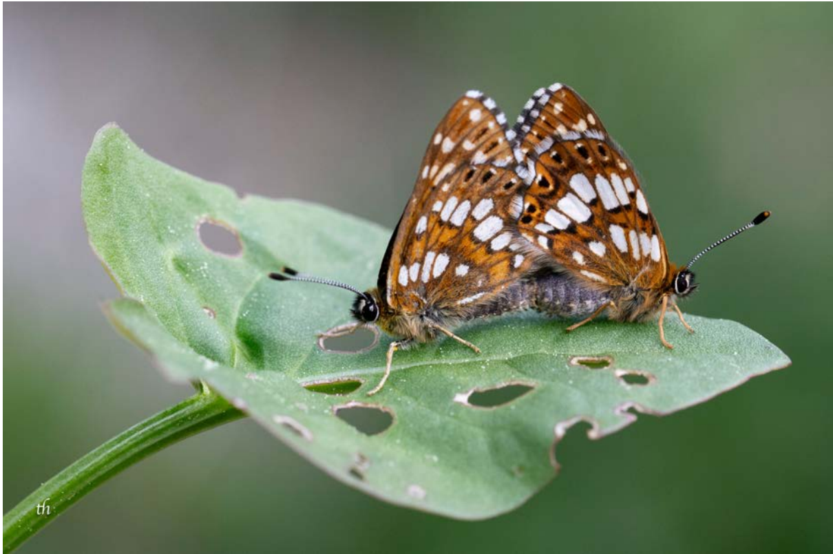
Paarung des Schlüsselblumen-Würfelfalters ( Hamearis lucina ) (Thomas Heim)

Wir fahren nochmals direkt an den Fuss des Vanil Noirs um nochmals nach dem Blauschillernden Feuerfalter ( Lycaena helle ) zu suchen. Das Wetter ist definitiv besser als am Vortag. Wir spazieren in Schlangenknöterich-Rasen zum Platz vom Vortag. Leider haben wir mit dem Blauschillernden Feuerfalter kein Erfolg, eventuell sind wir noch ein paar Tage zu früh im Jahr. Beim Platz mit den Kreuzottern entdecken wir eine schöne, dicke, aber junge Kreuzotter. Wir können sie lange studieren und sie bleibt an Ort und Stelle, bis wir diese verlassen. Am hintersten Punkt finden wir wiederum den Wegerich-Schneckenfalter und plötzlich finden wir die Zielart, und zwar ganze fünf Stück auf engstem Raum, der Schlüsselblumen-Würfelfalter ( Hamearis lucina ).