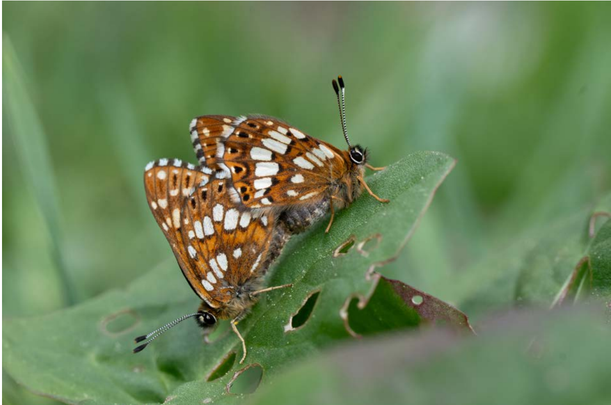
Schlüsselblumen-Würfelfalter ( Hamearis lucina ) (Christian Roesti)

Einleitung: Auf dieser Tagfalterreise wollen wir uns den früh im Jahr fliegenden Tagfalter-Arten widmen. Ob beobachten, bestimmen oder fotografieren, auf dieser Reise haben wir viel Zeit, uns den Tagfaltern zu widmen. Christian Roesti ist begeisterter Feldbiologe.