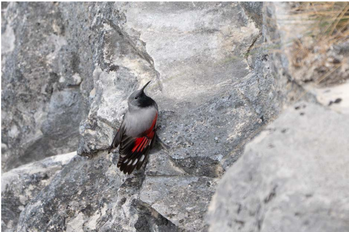
Männchen des Mauerläufers (Christian Roesti)