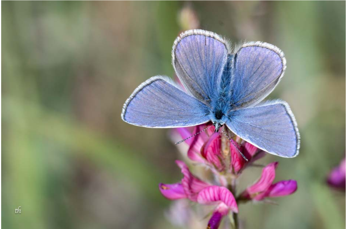
Männchen des Esparsetten-Bläulings ( Polyommatus thersites ) (Thomas Heim)