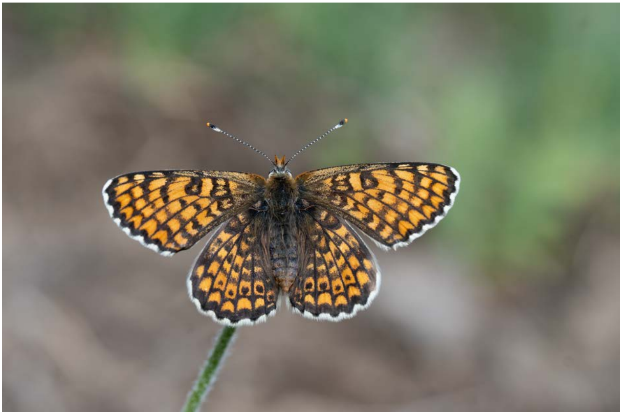
Wegerich-Scheckenfalter ( Melitaea cinxia ) (Christian Roesti)