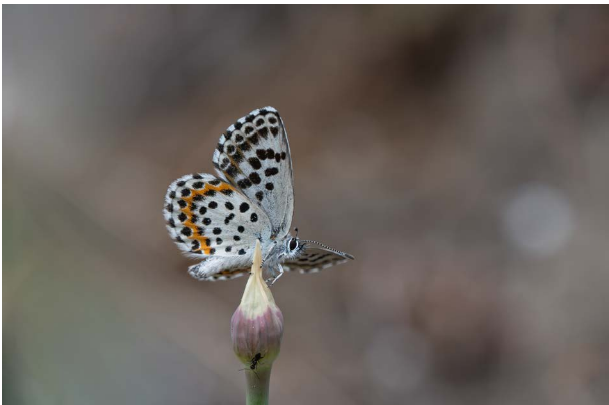
Fetthennen-Bläuling ( Scolitantides orion ) (Christian Roesti)