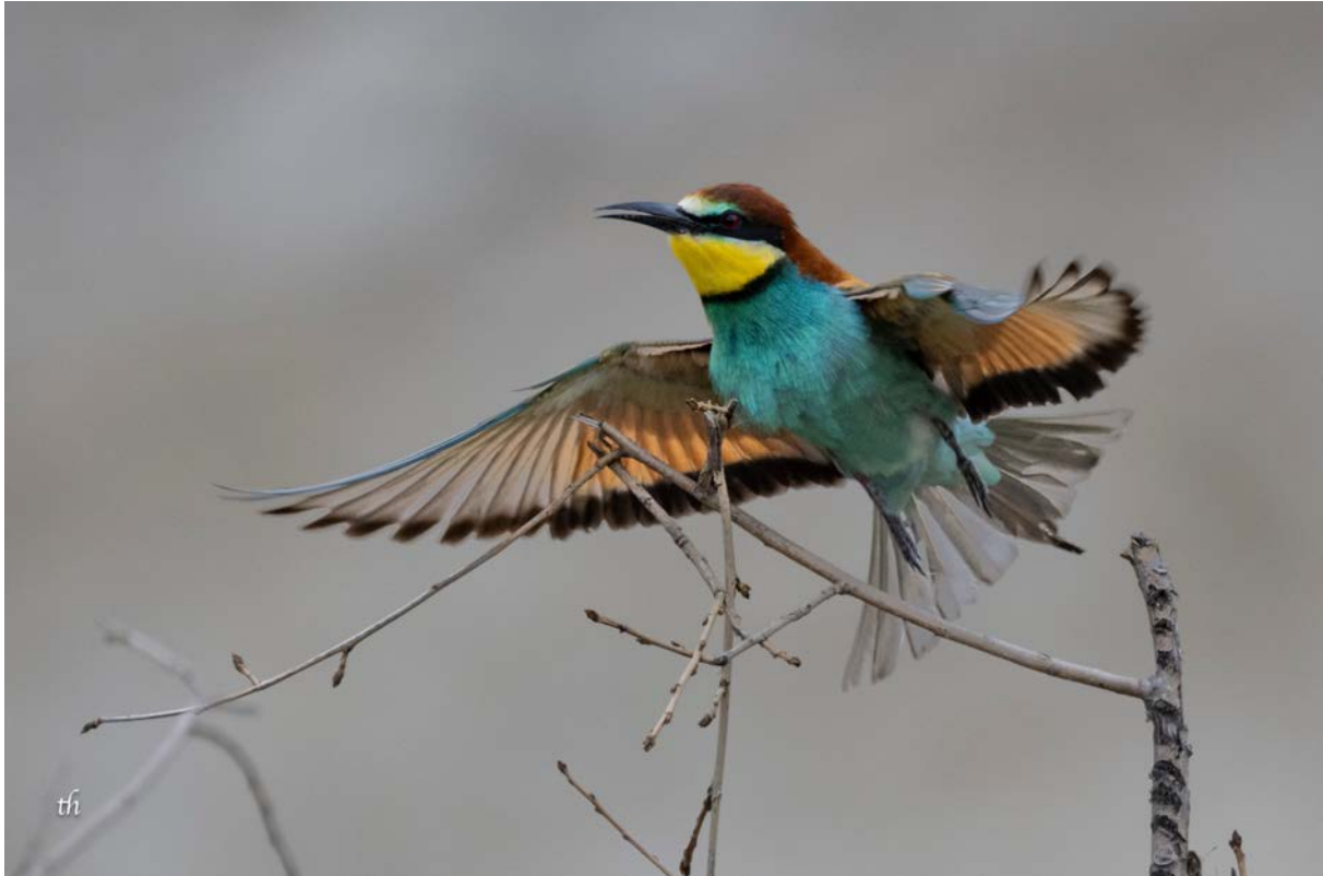
Bienenfresser bei der Landung (Thomas Heim)