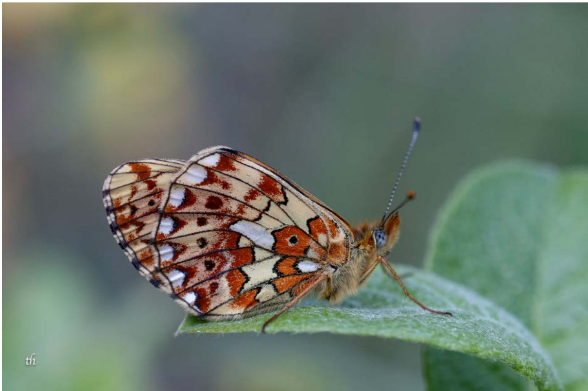
Frühlings-Perlmutterfalter ( Boloria euphrosyne ) (Thomas Heim)