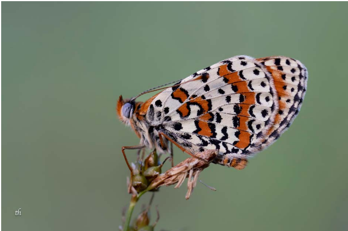
Männchen des Roten Scheckenfalters ( Melitaea didyma ) (Thomas Heim)