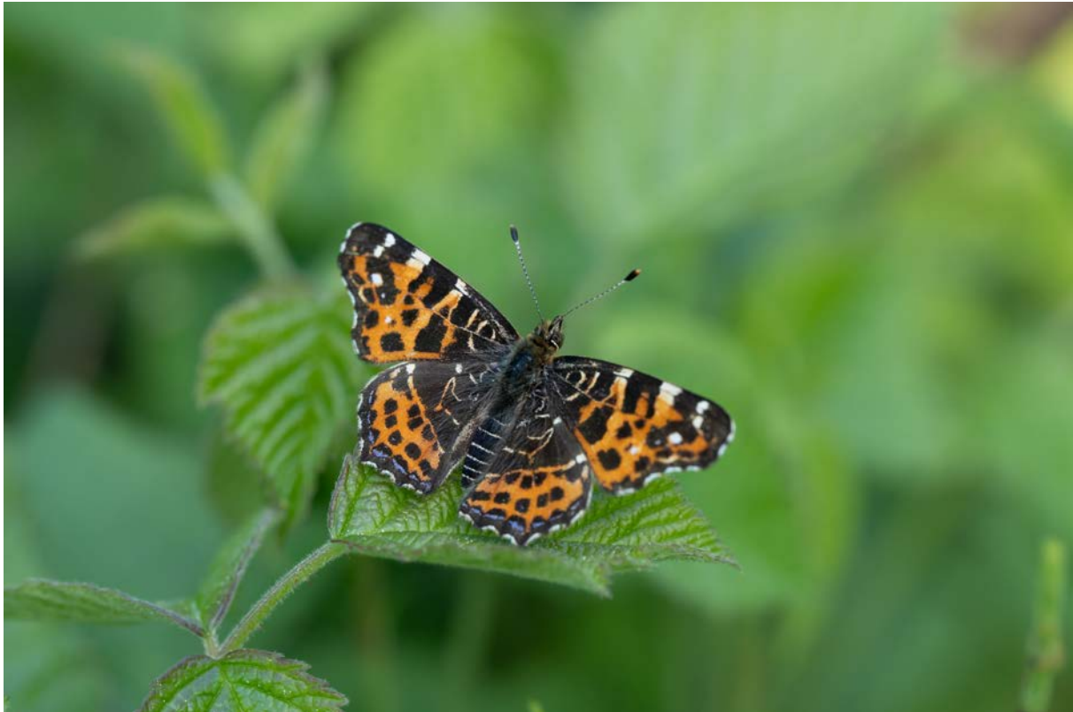
Landkärtchen in der Frühjahrsform ( Araschnia levana ) (Christian Roesti)

Nach einem Stopp in einem Bergrestaurant und Regenbruch geht es weiter zu einem Standort des Landkärtchens ( Araschnia levana ) im Rhonetal. Das Wetter spielt zuerst nicht mit. Als wir bei der hintersten Stelle Schwarzkehlchen beobachten, kommt plötzlich die Sonne, schnell sind wir zurück an der guten Stelle mit der Frühjahrsform des Landkärtchens und jetzt sitzen sie zuoberst auf Brennnesseln, Klatschnelken und Geissbarten. Was für ein Highlight! Danach fahren wir nach Chamoson, wo wir den Uhu nicht sehen, aber eine schöne Zeit haben mit dem Gesang der Blaumerlen, Bluthänflingen und Hausrotschwänzen. Wir fahren danach nach Leuk, wo wir im Walliser Spycher eine super Pizza essen.