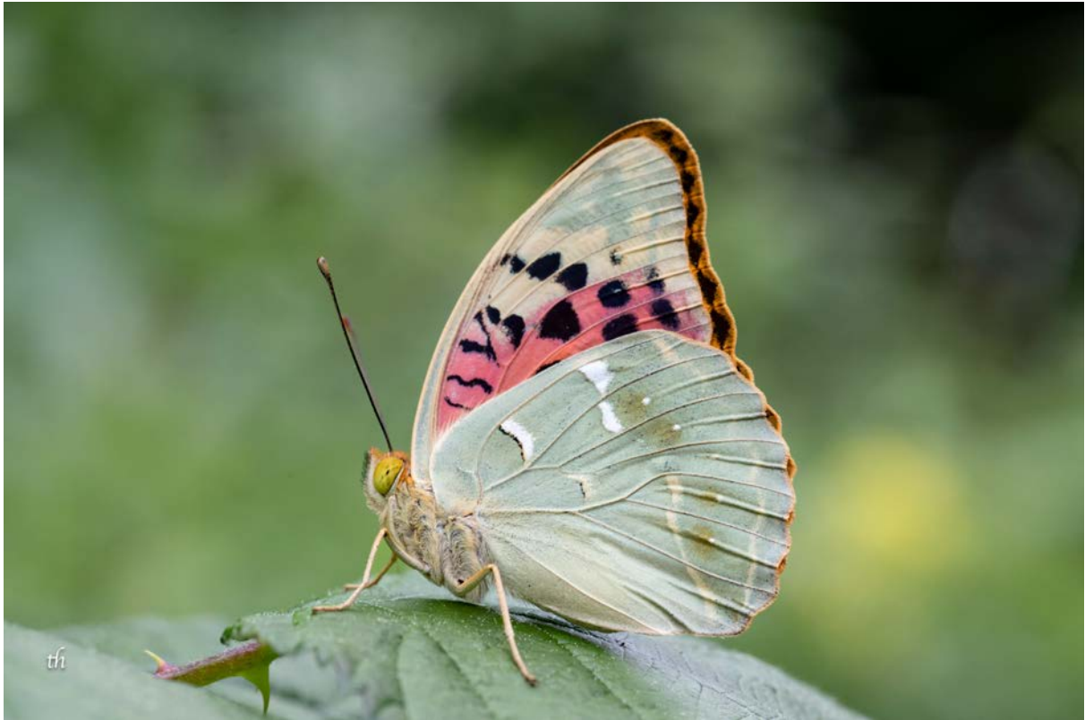
Männchen des Kardinals ( Argynnis pandora )

noch dem Fetthennen-Bläuling ( Scolitantides orion ) einen Besuch abstatten. Einige gehen um 16:00 Uhr auf den Zug, der Rest fährt nach Bern