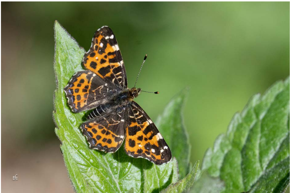
Landkärtchen in der Frühjahrsform ( Araschnia levana ) (Thomas Heim)