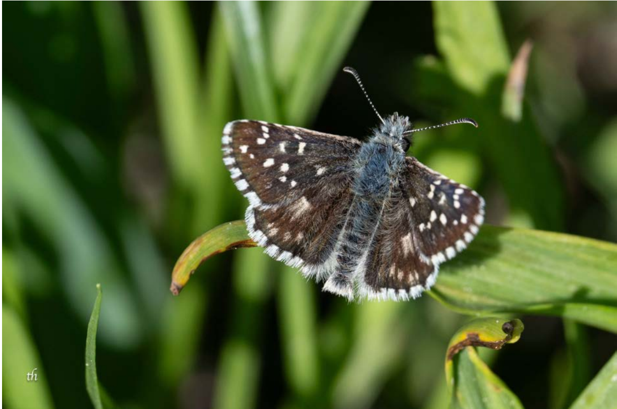
Zweibrütiger Wüfel-Dickkopffalter ( Pyrgus armoricanus ) (Thomas Heim)