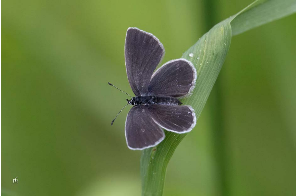
Weibchen von Cupido alcetas (Thomas Heim)