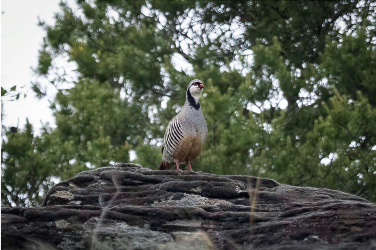
Steinhuhn-Männchen, was für ein Foto für die Distanz!